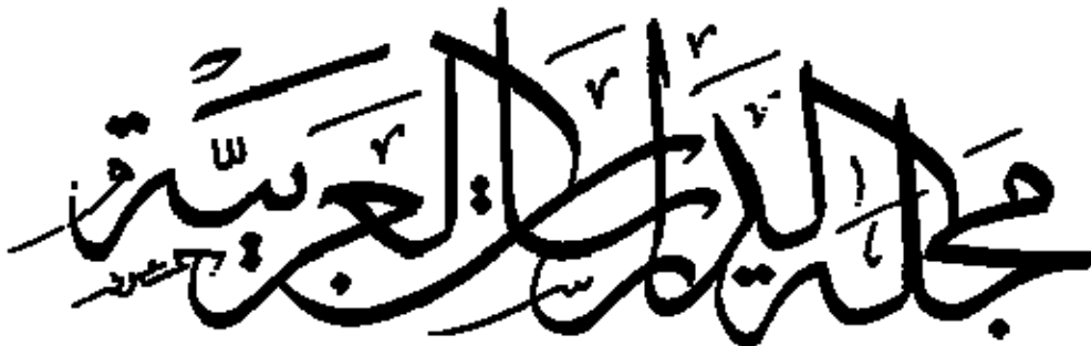
"Revista de Estudos Árabes" - Caligrafia de Hassan Massoudy para a capa da Revista de Estudos Árabes do DLO-FFLCH-USP.

Dada sua estatura religiosa e considerando sua infinita gama de qualidades estético-estilísticas, a Caligrafia não se restringe apenas à mesquita: faz parte do ambiente didático da madrassa(3); entra na composição decorativa da cerâmica, da tapeçaria e de mosaicos; alça-se aos cimos de monumentos e palácios; chega às tumbas; adquire, por vezes, no entanto, o caráter documental de uma época, pela celebração de nomes e de feitos de governantes; integra pergaminhos e livros científicos e literários, participando, assim, de instâncias que a fazem penetrar também no domínio do profano.